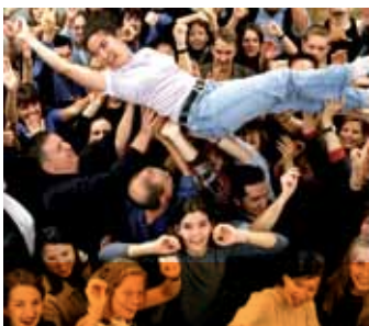
A successful team/Im Team zum Erfolg

für Menschen unter 25, die einen ersten Beruf erlernen